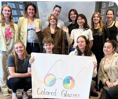
Teilnehmende einer COLORED GLASSES Schulung 2025